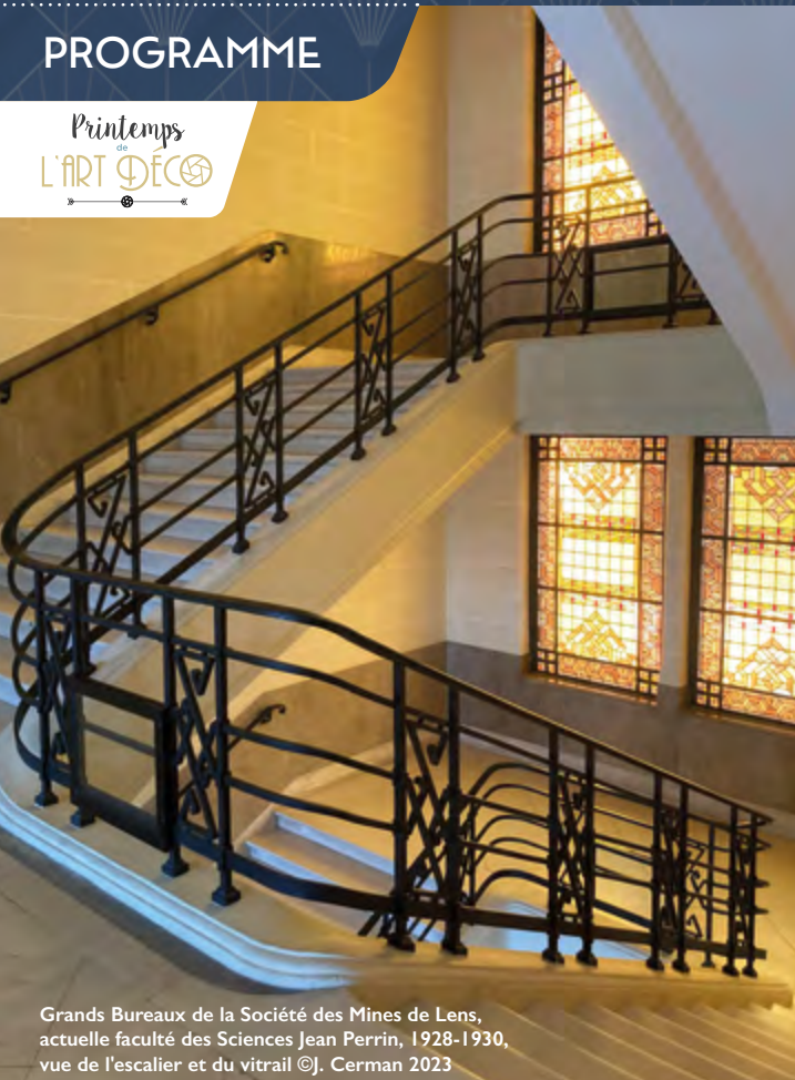
Grands Bureaux de la Société des Mines de Lens, actuelle faculté des Sciences Jean Perrin, 1928-1930, vue de l'escalier et du vitrail