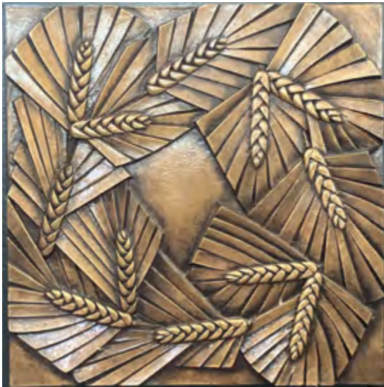
Raymond Subes, détail d'un banc de communion, cathédrale Notre-Dame-et-Saint-Vaast, Arras