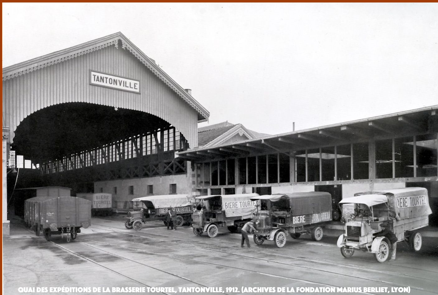
QUAI DES EXPÉDITIONS DE LA BRASSERIE TOURTEL, TANTONVILLE, 1912.